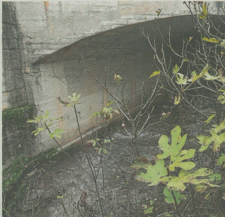
Tras las obras del colector, las aguas residuales no verterán en el Ego. A.L.

Se puede participar en esta iniciativa y sumar kilómetros inscribiéndose en la web 'La Hora del Planeta' eligiendo un deporte en el que participar y añadiendo una distancia.