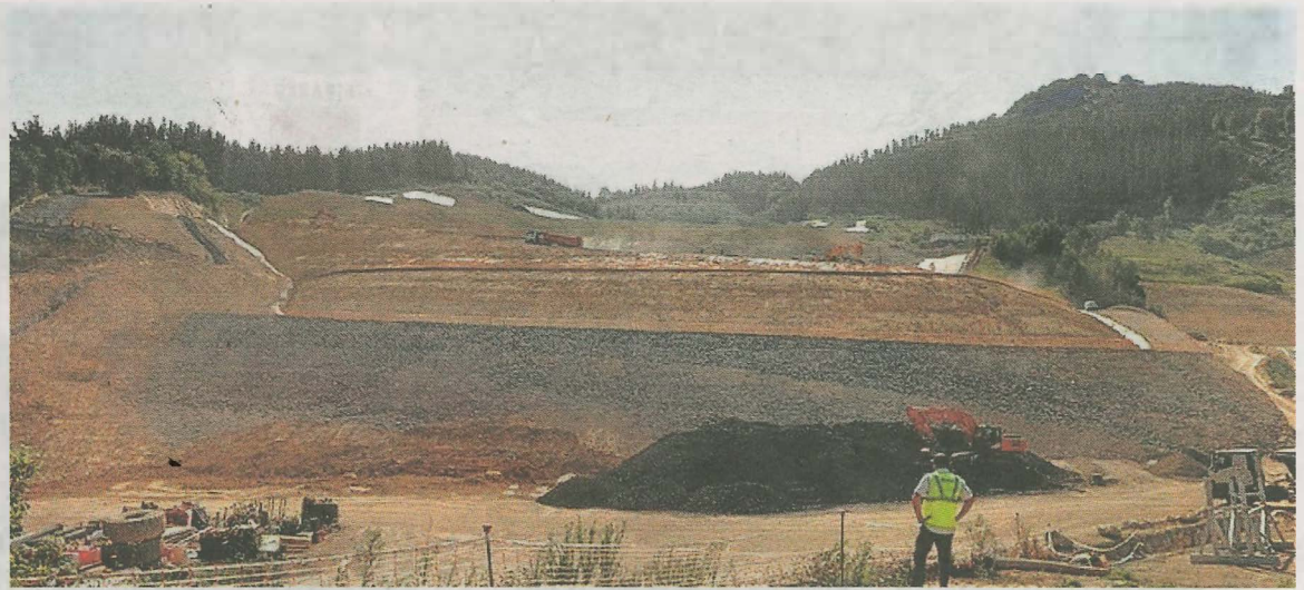
Imagen de los trabajos de estabilización que se desarrollaron en 2021 en el vertedero.

En la vecina localidad de Mallabia, la hoguera de San Juan se encenderá mañana, a partir de las 20.00 horas en el bidegorri de Ansoaga. En caso de lluvia, esta actividad quedará suspendida.