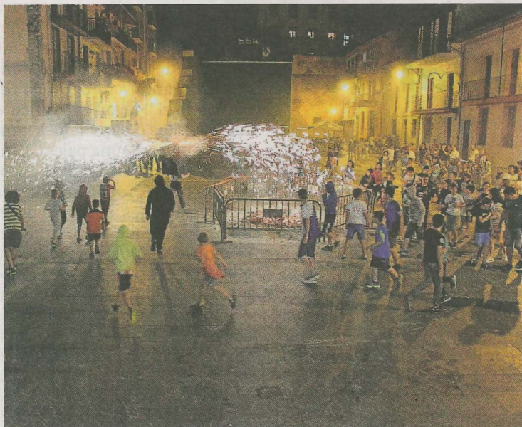
El toro de fuego es uno de los atractivos de esta velada en Ermua.

El mandatario ermuarra muestra su «preocupación» por las noticias publicadas en los medios de comunicación y no ha dudado en solicitar esa información «en mi labor de proteger los intereses de los y las vecinas del municipio, convencido de que tanto la seguridad como la salud de todos y todas ellas es lo más importante».