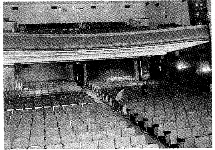
Las proyecciones de cine regresan con el Ermua Antzokia.