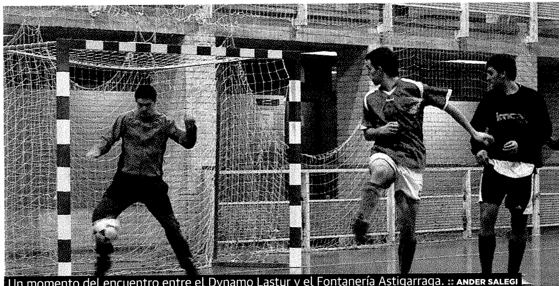
Un momento del encuentro entre el Dynamo Lastur y el Fontanería Astigarraga.

La sala de Kultur Elkartea recoge una serie de paneles con fotos y texto sobre este tema. Una cuestión por la que ya se han interesado unos cuantos vecinos, y que se cerrará al público al final de esta semana.