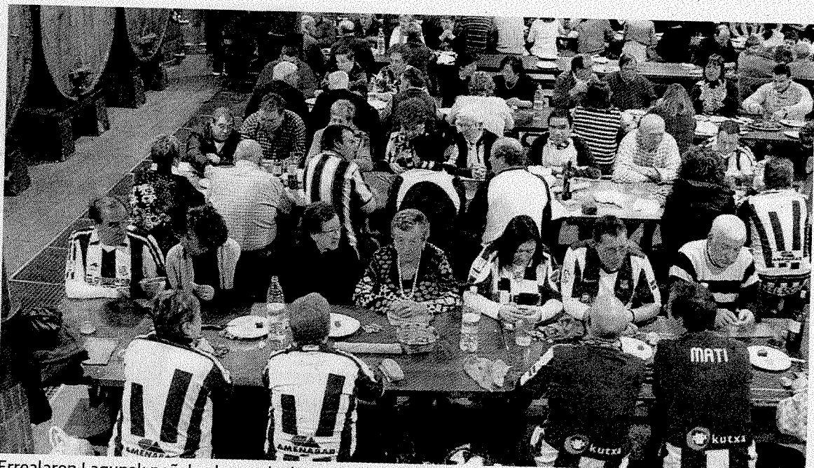
Errealaren Lagunak peñakoak aurreko batean izandako bazkarian. ■ GORRITIBERIA

Quien está 'que se sale' es el conjunto juvenil del Burumendi que ostenta el liderato del grupo segundo, de la fase de ascenso a la división de honor. Los entrenados por Igor 'Txaparro' jugarán mañana, domingo, a partir de las 2 de la tarde frente al Santo Tomas Lizeoa, en el cam-