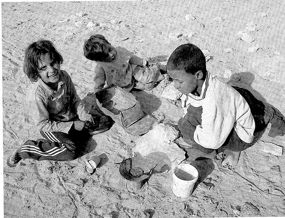
Niños saharauis juegan en un campamento de refugiados de Tinduf.

La permanencia de estos pequeños saharauis en los hogares