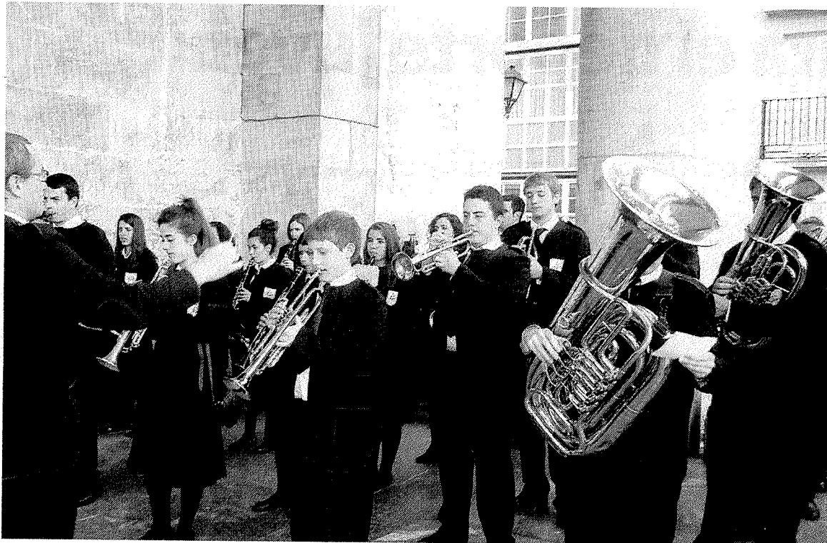
Un total de 28 músicos participaron con la Banda en la función del pasado Viernes Santo. == GORRITIBERIA