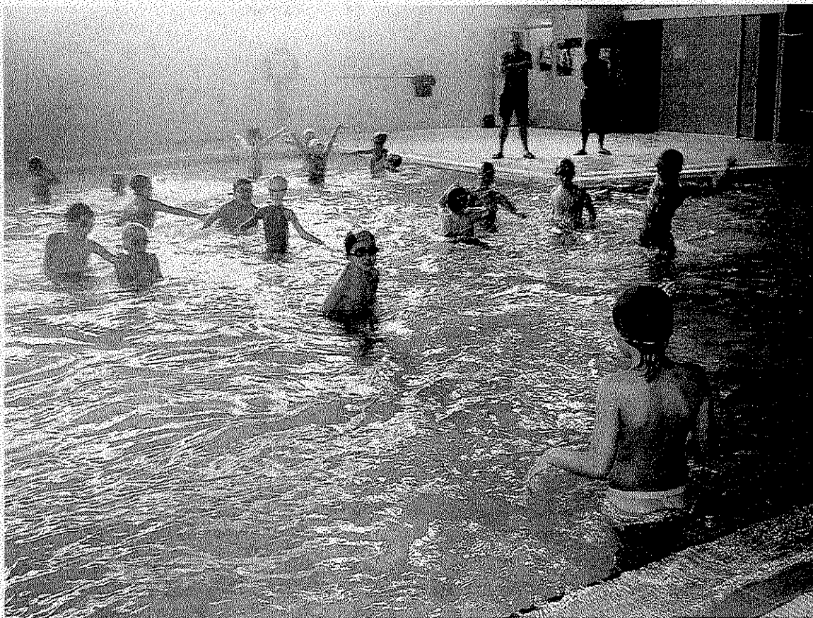
Un grupo de niños jugando en la piscina pequeña del polideportivo.

Como novedad, cabe destacar, que los 'Intensivos de Natación' amplían en cinco minutos la duración de cada sesión con el objeto de profundizar en los contenidos didácticos y pedagógicos del día a día y así poder finalizar la actividad con diferentes juegos para favorecer la