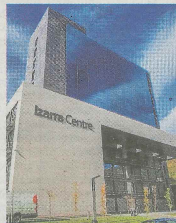
La Tecnoteka está ubicada en Izarra Centre.

Este servicio ofrece un horario amplio a lo largo de todo el año, horario que en época de exámenes se alarga para atender un uso más intensivo y prolongado. Así, el servicio estará abierto 17 horas diarias y continuadas hasta finales de junio para las personas usuarias, de lunes a domingo en el interva-