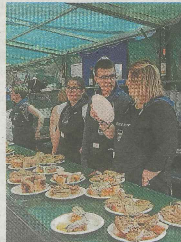
Se vendieron diferentes pintxos de anchoa.