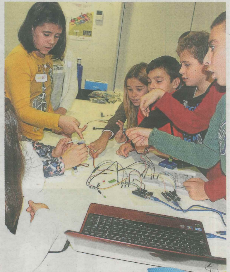
Jóvenes participantes en un taller anterior.

lar (entre 8 y 16 años) para que den sus primeros pasos y desarrollar sus capacidades en los ámbitos de la robótica y la programación, impulsando, además, el trabajo en equipo y la resolución de problemas.