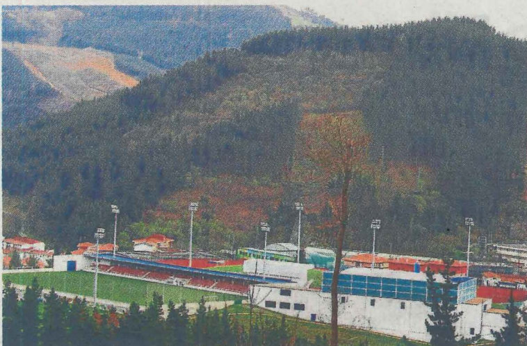
El 86% también cumple este tiempo con las instalaciones de Betiondo. A. L.

Komite Internazionalistak de Ermua organizó una concentración para denunciar los ataques del ejército israelí contra la población palestina, denunciando que los bombardeos «hasta la fecha han provocado la muerte de más de 200 personas, la tercera parte de ellas niños y niñas».