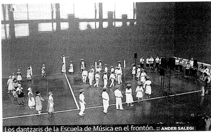
Los dantzaris de la Escuela de Música en el frontón.