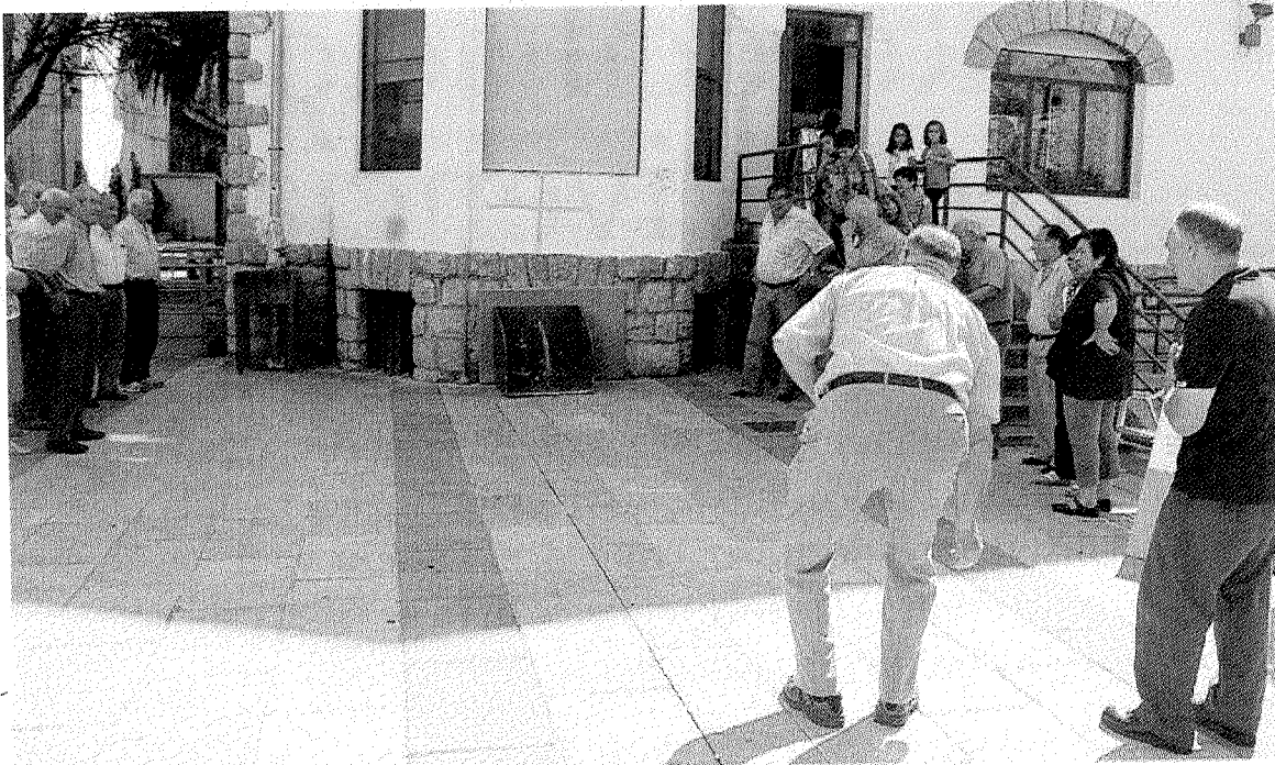
Un jubilado lanza la ficha a la toca en el campeonato del Club Arbil.