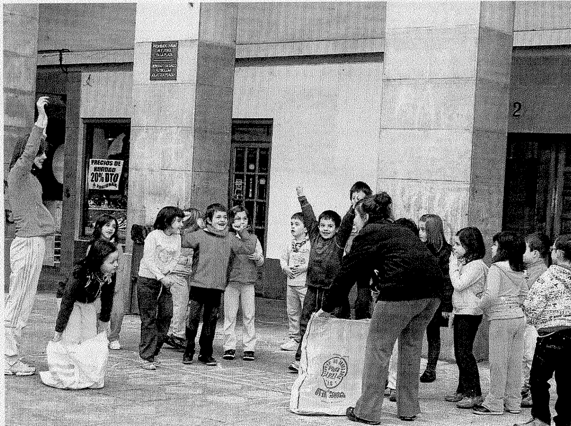
Asistentes a las colonias de invierno se lo pasaron en grande con las carreras de sacos. ■ A.L.

El grupo de los niños y niñas de tercero y cuarto de Primaria, además de visitar Lekunberri contarán con una exhibición de primeros au-