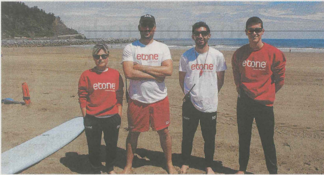
Algunos de los socorristas que vigilarán este año la playa debarra.