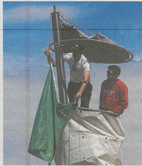
Colocando la bandera.