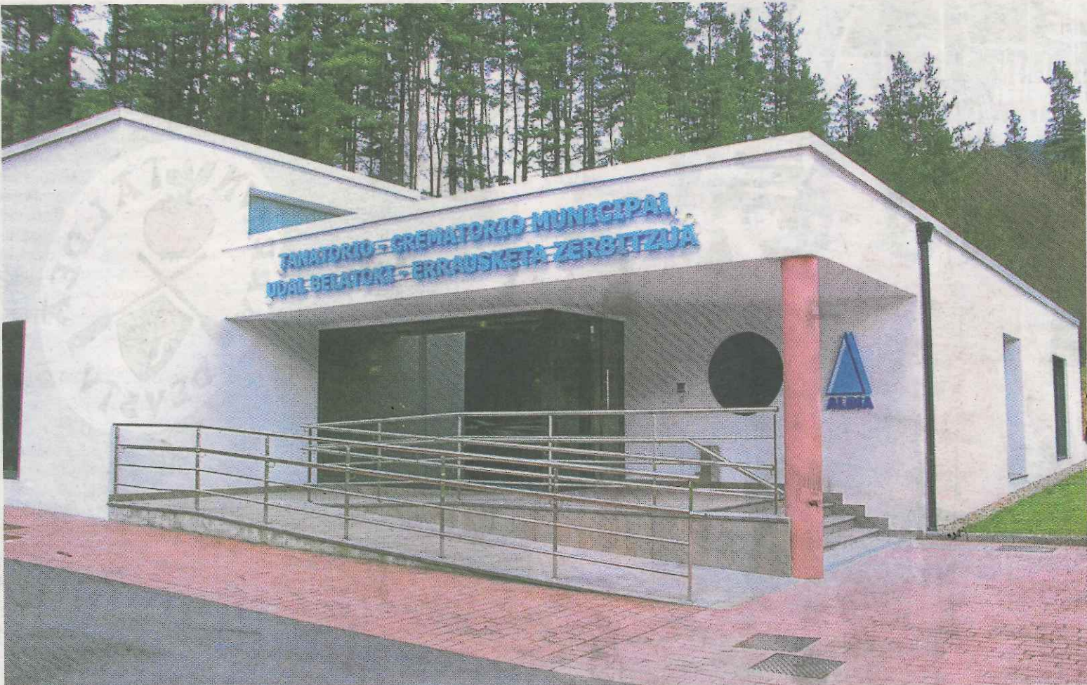
Vista del exterior de las instalaciones del tanatorio-crematorio de Ermua que fueron inauguradas hace año y medio.