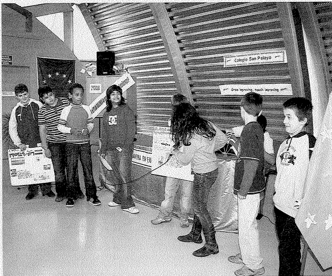
Escolares de San Pelayo en una de las actividades organizadas el pasado año en el centro.