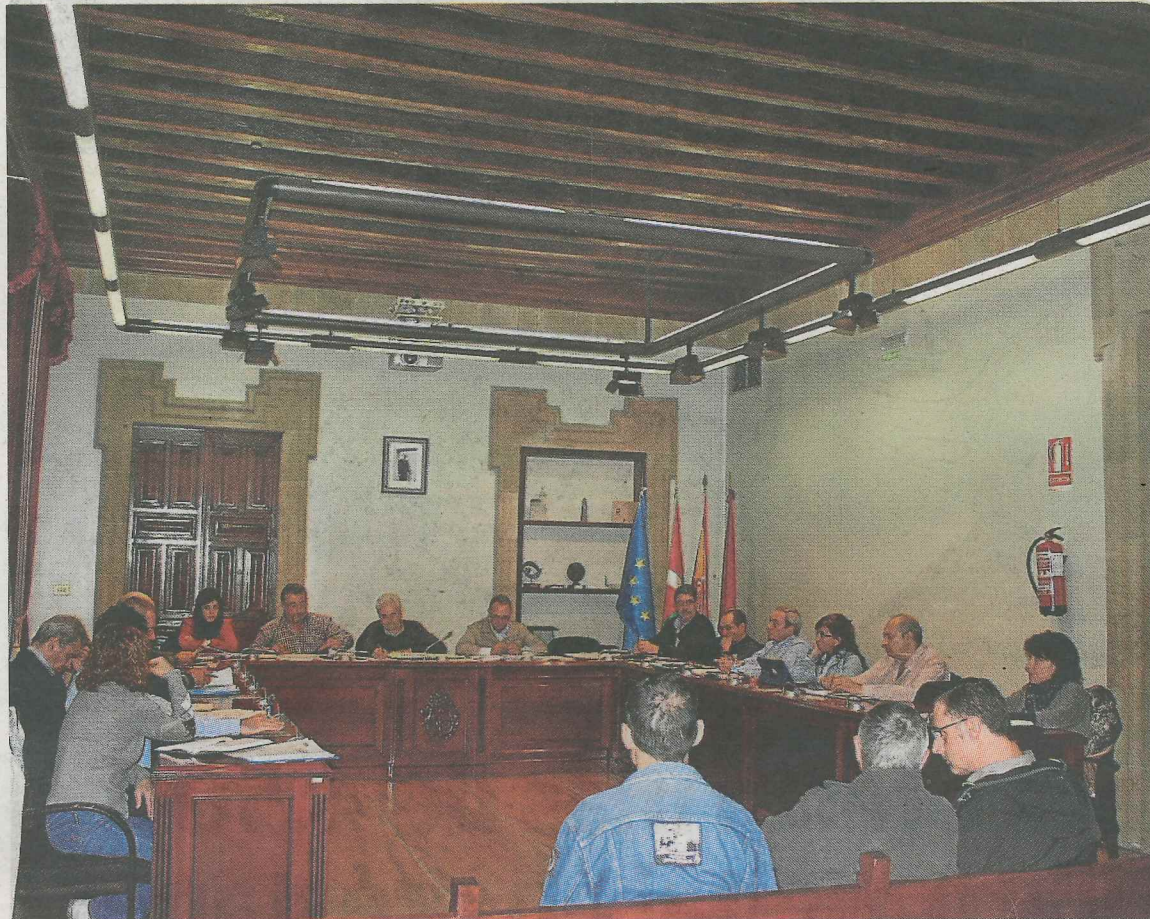
Los concejales ermueños aprobaron en la sesión plenaria las cuentas para el próximo año.

Bildu también afirmó que «el dinero invertido en políticas de em-