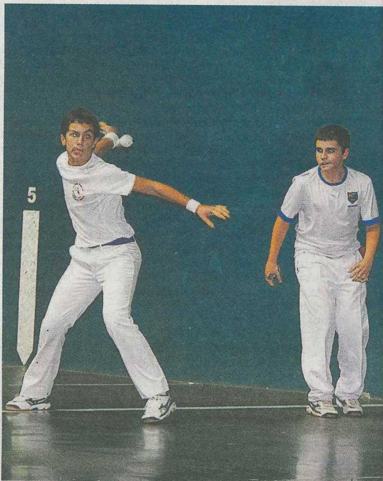
Los pelotaris de Euskal Jolas no descansan el fin de semana.