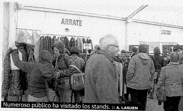
Numerooso público ha visitado los stands.

en la actividad. Los primeros días han sido los que más visitas han registrado, quizá porque la población acudió para encontrar el producto que posteriormente podía desaparecer. Con esta actividad estos comercios pretendían terminar de rematar la temporada de otoño e invierno y liquidar el género de la campaña. Han sido 3 días de oportunidades, chollos y artículos a precios inmejorables en sectores diversos como moda hombre, mujer, infantil, calzado, complementos o hogar.