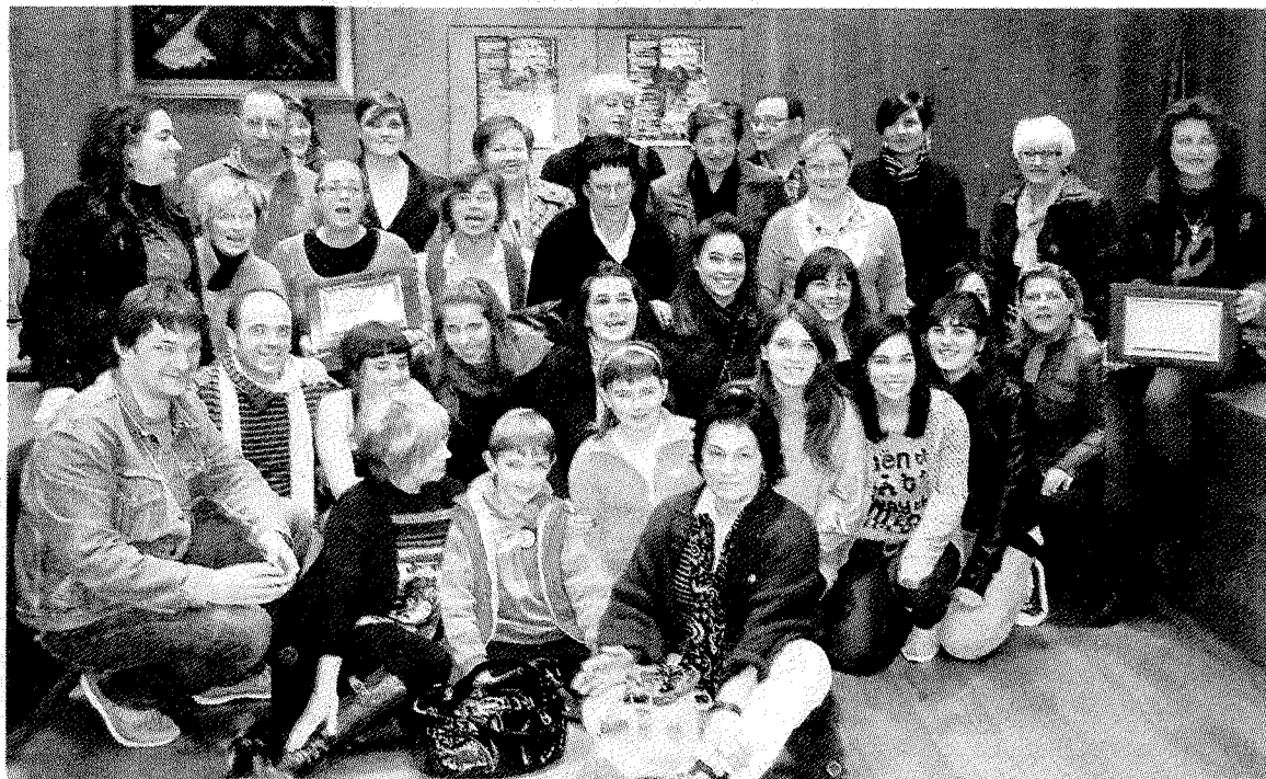
Argazkian bi taldeak sariak jaso ondoren.

Por lo que respecta a la línea 'Yurrita', los 'chipirones a lo pelayo' y 'chipirones en su tinta' son los más novedosos. Pero no termina ahí las novedades dado que provenientes de la planta que recientemente han adquirido en Zumaia, la firma mutrikuarra presenta también las 'cro-