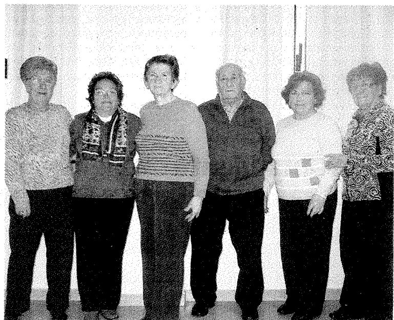
La junta directiva del Hogar se mantendrá un año más.

Se desarrollarán los próximos días 24 y 26 de marzo, es decir; el