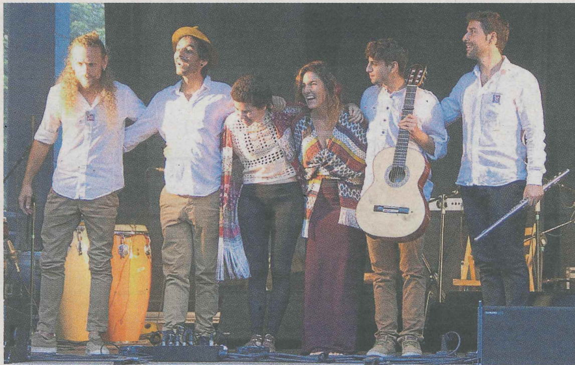
Los integrantes de Entre Orillas durante la última edición del Folkez blai en Ermua.

—Como nunca habíamos tocado por el norte y no sabíamos cómo iba a funcionar, íbamos un poco nerviosos, pero lo pasamos muy bien. Nos fuimos en autocaravana y con la organización estuvimos muy bien. Hubo público muy variado y muy atento.