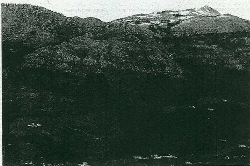
Burdin Kurutz taldekoek hainbat menditik egingo dute txangoa, izarraitz mendia barne.

Lehenengoa joan den igandean ospatu zen, eta parte hartzaileak Bariatou (Frantzia) aldera joan ziren. Pausu, Ibardin Mandale eta Txoldoka mendietatik lasai ibili ziren. Hurrengo txangoa, azaroaren 2an izango da. Animatzen direnek Dorleta, Alabieta, Degurixa, Andarto/Arluz eta Mendiola mendiak ezagutuko dituzte. Hilabete horretan ere, 30ean, eta urteari amaiera emateko, Araia mendietara abiatuko dira mendizaleak. Aizkorbe-Erga-Irurzun ibilbi-