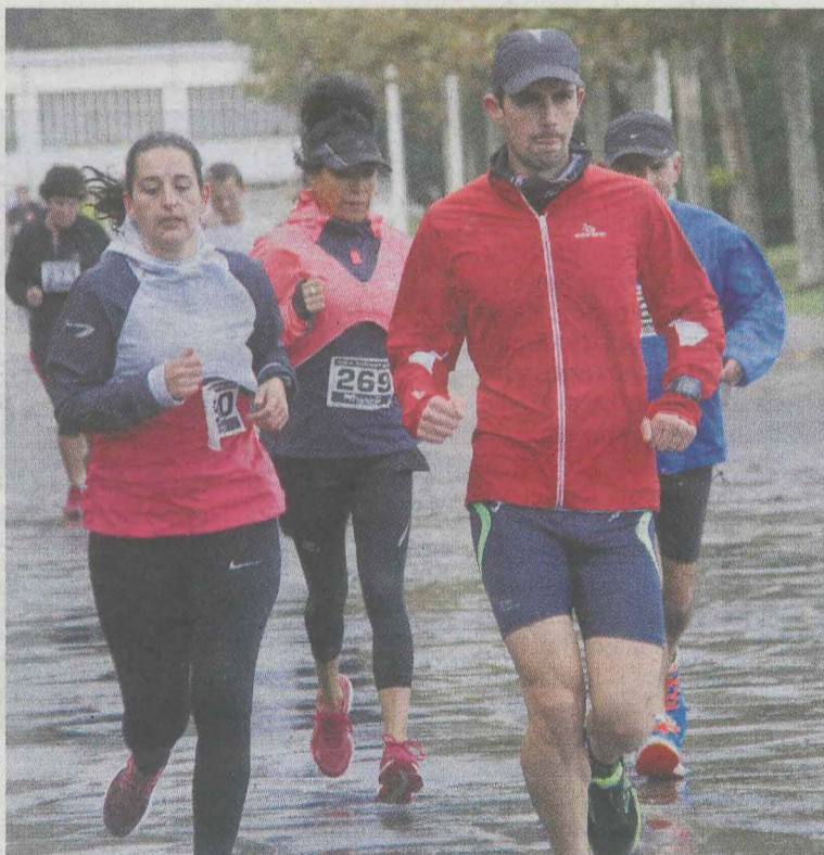
Este año la prueba no será por parejas sino individual.

El plazo de inscripción se encuentra abierto hasta el mismo día de la prueba. Por lo que las personas interesadas en participar podrán dar su nombre en la página web herrikrosa.eus, por un precio de 11 euros hasta el viernes por la noche, o si no la otra opción es apuntarse el mismo día de la competición, (hasta media hora antes de la salida) a cambio de 15 euros. Los atletas deberán de comprobar que su nombre figura en la lista de inscritos antes del día de la prueba y de que su nombre aparece como 'pagado' en el listado. De no ser así, el día de la carrera, deberá de presentar el justificante del pago o debe-