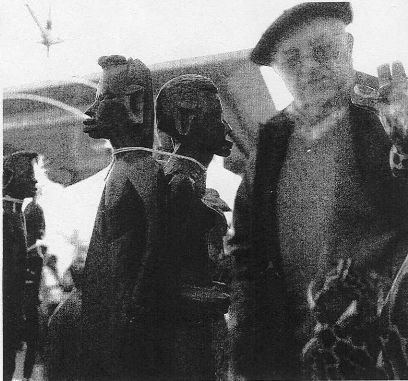
ARTESANÍA. Un hombre observa varias piezas talladas en madera. A la derecha, otro de los puestos informativos de la feria africana.