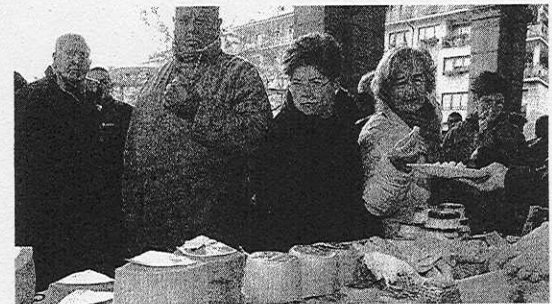
QUESOS. Degustación de variedades bajo los arkupés.

Junto a esos productos, también se podrán adquirir pan, chocolate respostería o txakoli en alguno de los 20 puestos previstos o miel a los 9 productores que acudirán a Elgoibar. Además no faltarán las conservas de pesca o vegetales (4 vendedores), el foie-gras o productos más novedosos como los elaborados con aloe vera. Todos esos pues-