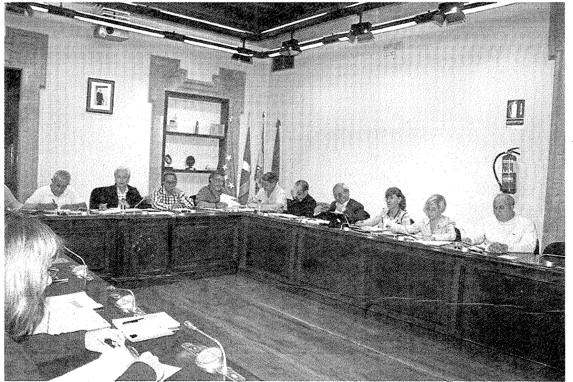
Los concejales ermuarra se unieron en la votación a favor de este texto.

Por último pretenden «trabajar para que el día del euskera sean los 365 días del año».