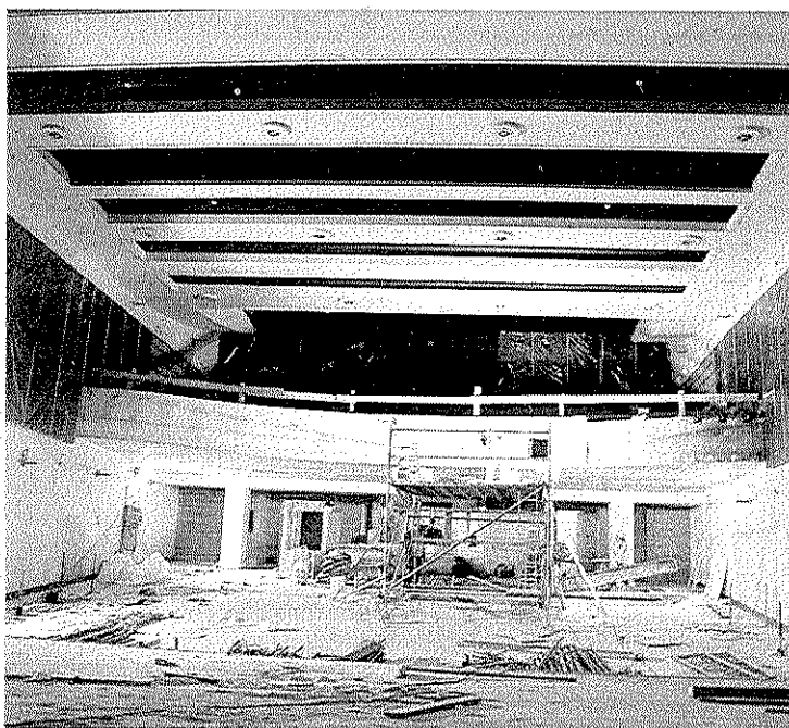
Las obras en el edificio avanzan a buen ritmo. :: A.L.

En la zona contigua a la sala de butacas (anterior entrada) se encuentran otras salas, pero en este caso se les dará un uso relacionado con la actividad artística que aún está sin determinar, debido a que se tratará con los colectivos locales implicados.