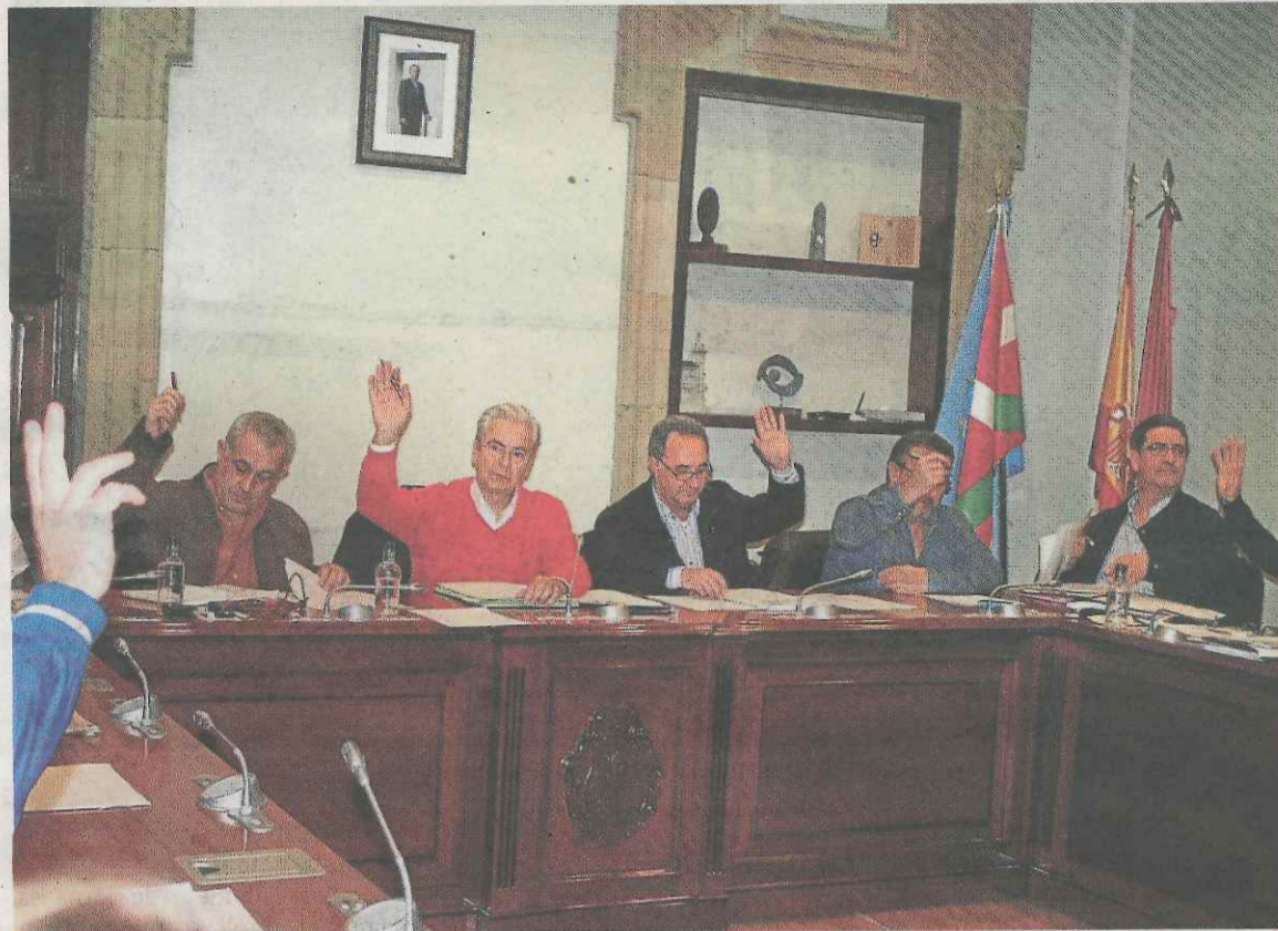
Los concejales del PSE y PP aprobaron el presupuesto municipal para este ejercicio.

«Destinamos parte de estas partidas a hacer itinerarios para las personas desempleadas, tener un conocimiento exhaustivo del mercado laboral y en función de eso impartimos cursos, realizamos formación a emprendedores y hemos dado empleo durante 3 meses a 70 personas. Casi medio millón puso el Ayuntamiento y 160.000 el Gobierno vasco. No es un calentón del año pasado. Es una estrategia de apoyo