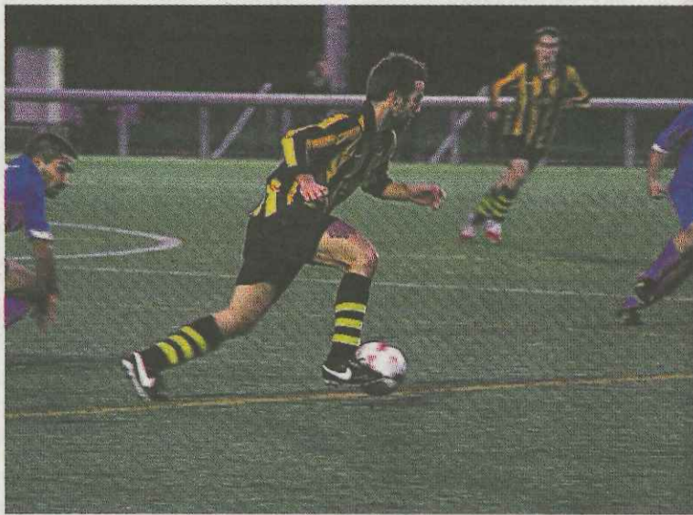
Al Amaikak de Preferente quiere asentarse en los puestos de arriba.

Los cadetes están realizando una gran temporada, pero la semana pa-