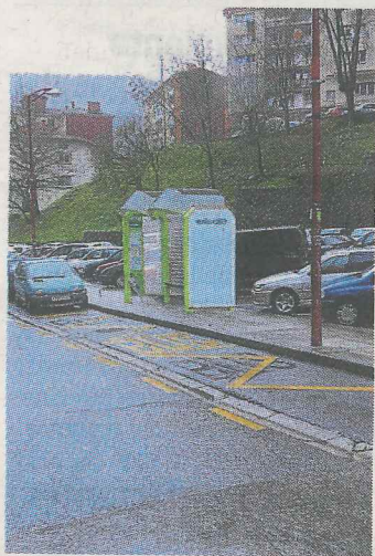
Fotomontaje de la marquesina.

Las tareas para su instalación comienzan hoy y se espera que concluyan para finales de esta semana. Los trabajos han dado inicio con las tareas de albañilería y de herrería para anclar la estructura, también se realizará una acometida eléctrica para dotar de luz a la marquesina. La instalación es una mejora solicitada por los viajeros y la Corporación, que ya la pidió en 2013.