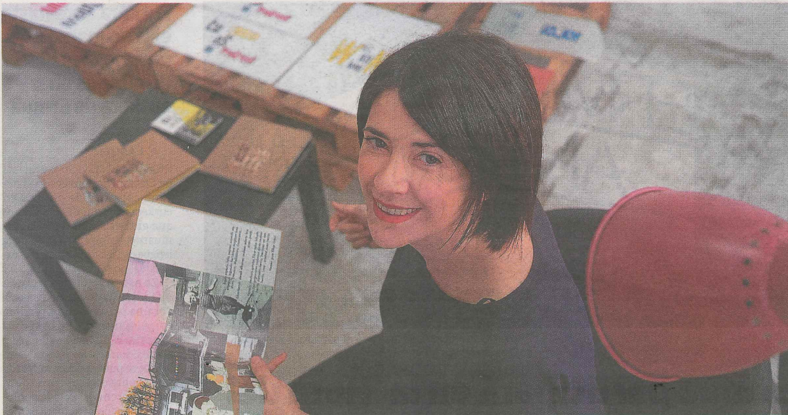
Ana Orozko ha plasmado en un cuento apto para todas las edades la historia industrial de la ciudad. :: FÉLIX MORQUECHO