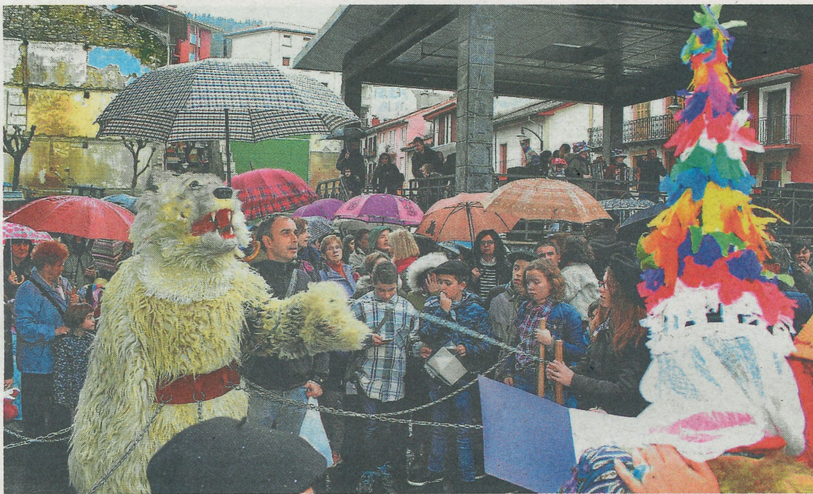
La actividad cumple su decimotercera edición, cantando los versos de Guillermo Bengoetxea. A. LASUEN