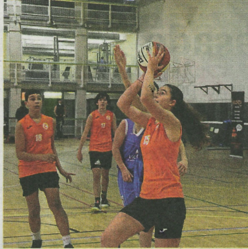
El Urkunde luchará por la primera victoria.