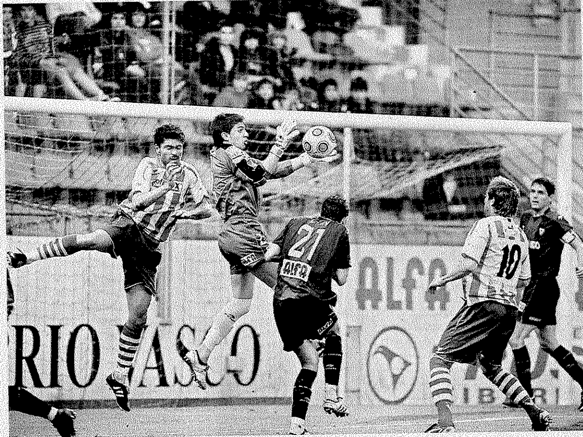
Viadero tiene claro quién defenderá la portería, aunque no lo adelantó... ■ M.E.

Ahora toca dar el siguiente paso, conseguir tres puntos que, incluso, podrían convertirse en los de la clasificación matemática para el play-off. «Tenemos ganas de que llegue el partido, de ganarlo y de asegurarnos cuanto antes el play-off». «Lo más importante es asegurar la plaza en el play-off y esta semana tenemos opciones de hacerlo. Lo más importante es intentar ganar. En este sentido, y pese a insistir en que «lo primero es asegurar la plaza y quedar lo más arriba posible», el entrenador azulgrana no se olvida de la importancia de que «las