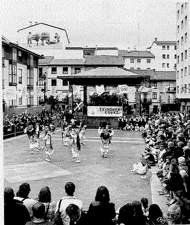
Celebración de 'Txindurri Eguna' en la plaza.

► Mañana, domingo: Diana de txistularis (10.00 horas), pasacalles txistularis y dantzaris (11.00), actuación en la plaza (12.30) y comida y romería (14.30)