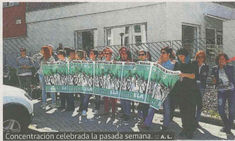
Concentración celebrada la pasada semana.

tamente precarios y los salarios bajos», según explican estos empleados. El sindicato ELA mantendrá durante estas semanas varias jornadas de paro para que la población ermuarra conozca la situación de «precariedad» en la que se encuentran estos trabajadores y trabajadoras. Los trabajadores y trabajadoras iniciaron los paros hace varias semanas. En imagen una de las concentraciones realizadas la pasada semana frente a la Residencia de Abeletxe.