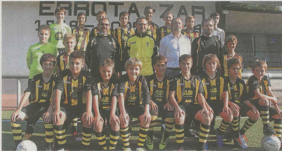
El infantil txiki ha realizado una buena fase de Copa.