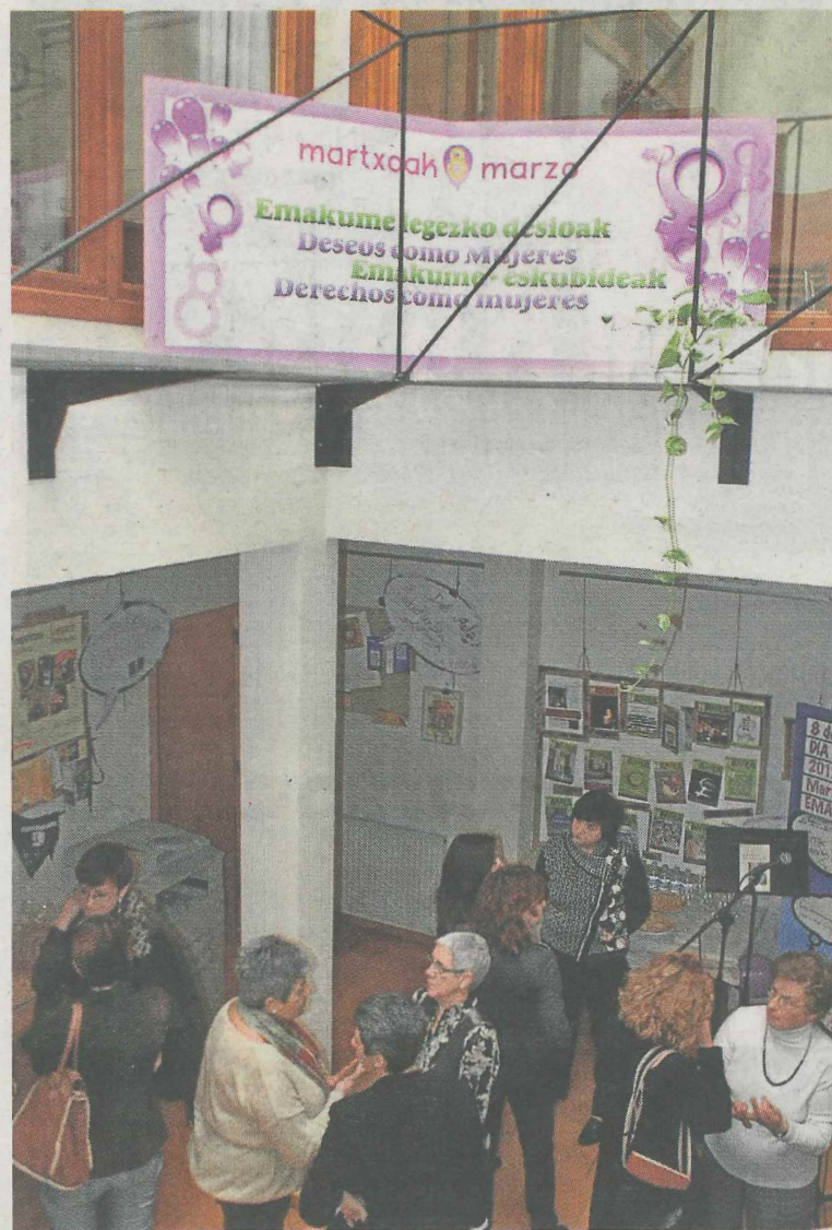
El encuentro se desarrollará en la Casa de la Mujer. ■ A. LASUEN

Esta normativa, cuya elaboración se quiere compartir con la población ermuarra en este momento, tratará de establecer el régimen jurídico de la igualdad de mujeres y hombres a nivel local, en el marco de las normativas establecidas a nivel internacional, europea, estatal