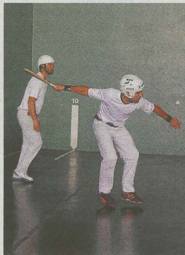
Deba contra Lazkao.

A mano, ya han terminado la temporada y lo hicieron la semana pa-