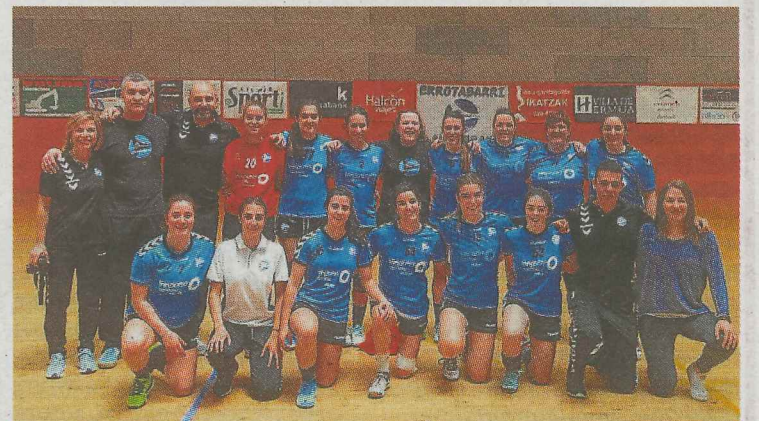
Errotabarri de División de Honor Plata al completo. :: K.I.