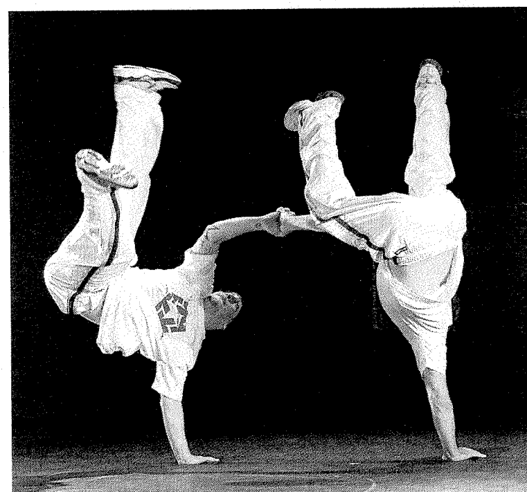
Las exhibiciones de danza de hip hop se podrán ver en Ermua.

Más tarde se volverá a los ritmos urbanos con las disciplinas musicales de african urban music, hip-hop, break-dance y beat box. Esta música continuará a partir de las 23.30 horas con hip-hop, la actuación de DJs y rap, reggae y soul. La fiesta se prolongará hasta la madrugada.