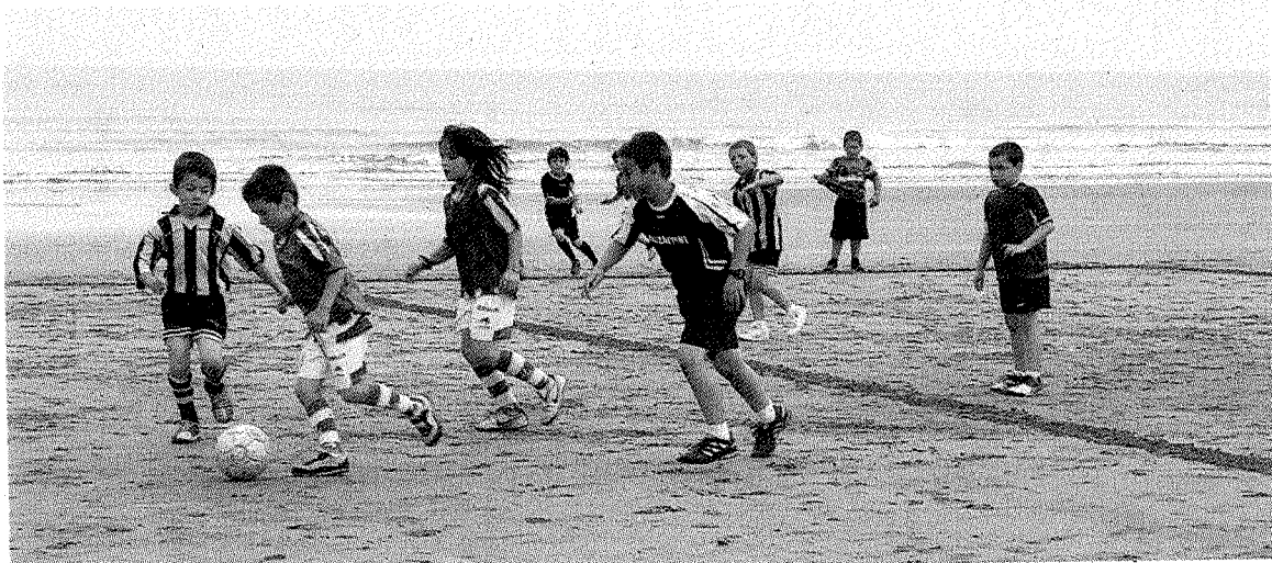
El torneo de fútbol vuelve este fin de semana a la playa debarra.