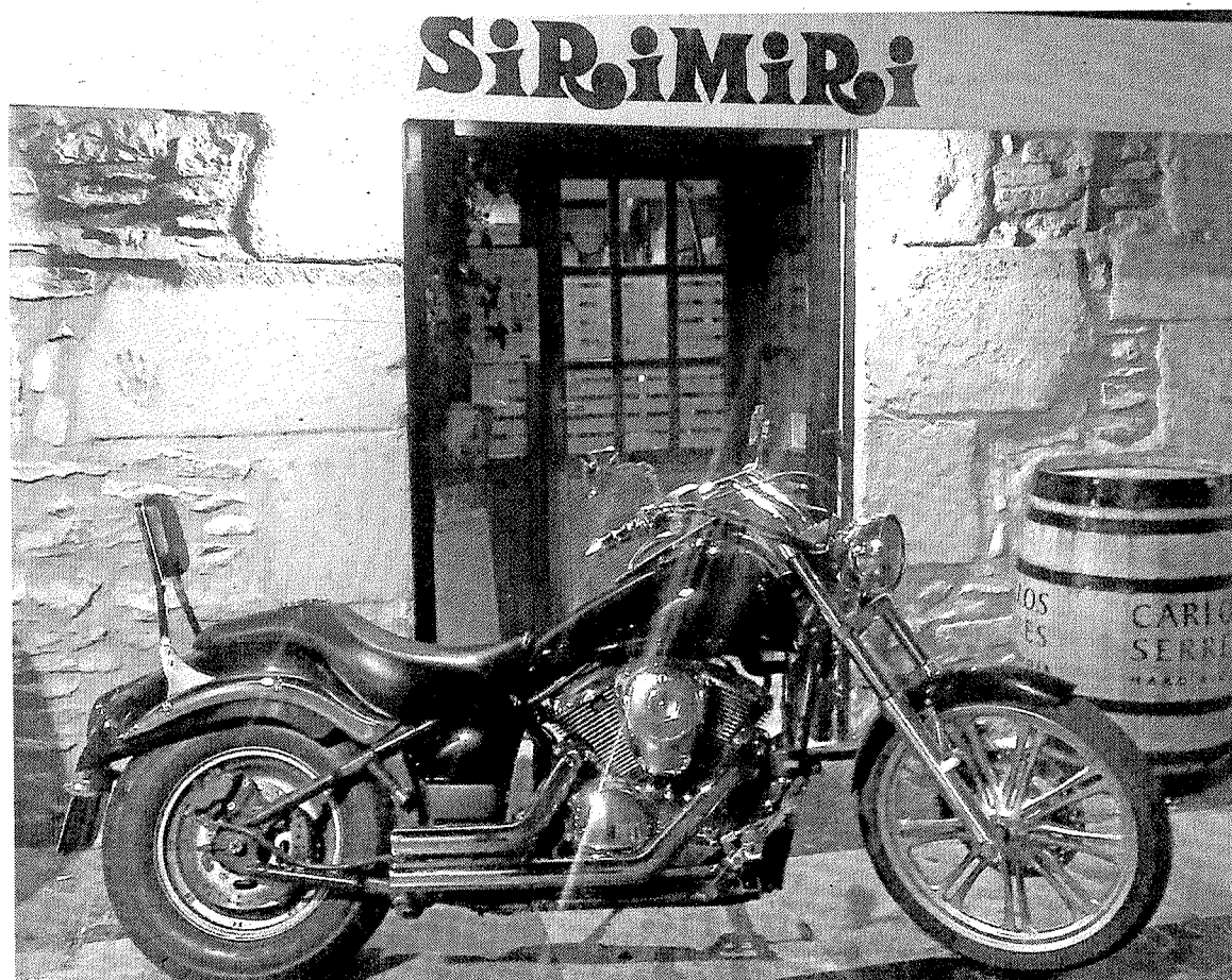
Los moteros realizarán un recorrido matutino por localidades del entorno.