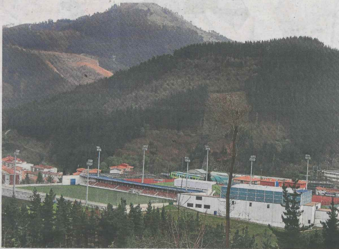
Vista del complejo deportivo Betiondo y del campo de fútbol Teodoro Zuazua.

La integración del sistema de ventilación, aier acondicionado y apertura de ventanas de la sala de 'ca'dio'