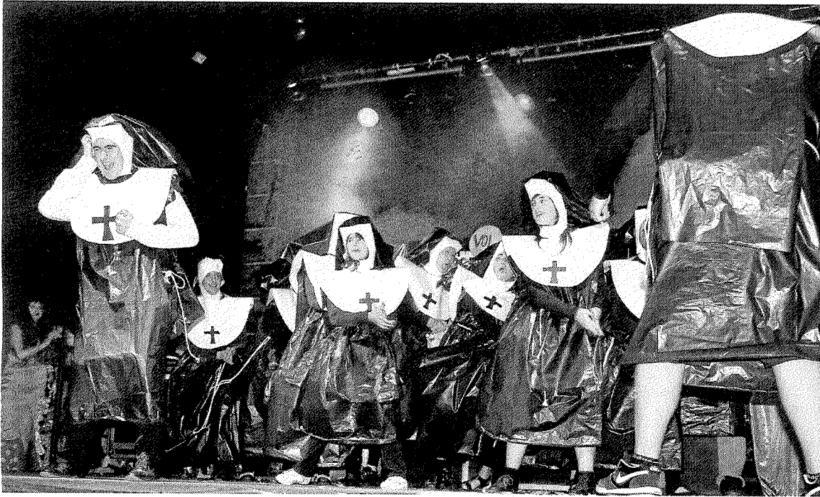
Gure Txokoa, con su espectáculo de las monjas de 'Sister Act' fue uno de los éxitos de la noche.