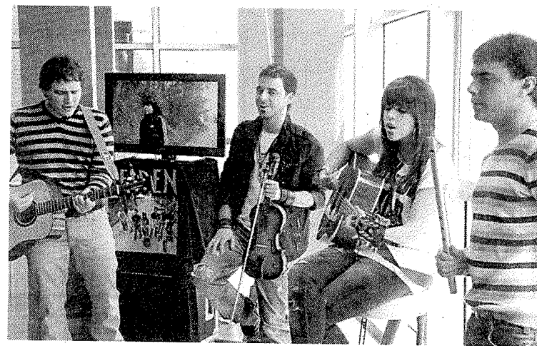
Seiren taldea, iazko argazki batean.

Seiren taldeak doinu lasaiagoak joko ditu, baina ez geldirik ego-