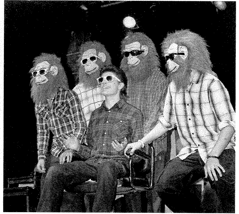
Las caracterizaciones fueron de lo más ingeniosas. :: A. L.