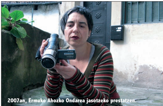
2007an, Ermuko Ahozko Ondarea jasotzeko prestatzen.