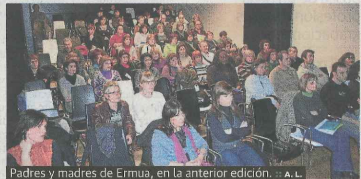
Padres y madres de Ermua, en la anterior edición.

En Educación Secundaria se podrán recibir consejos y pautas o herramientas para abordar temas como: 'Quiere salir de noche, ¿qué hago?' (jueves 29 enero), o abordar las incertidumbres del consumo de drogas (5 febrero) o cómo abordar el abuso del uso del local (12 febrero).