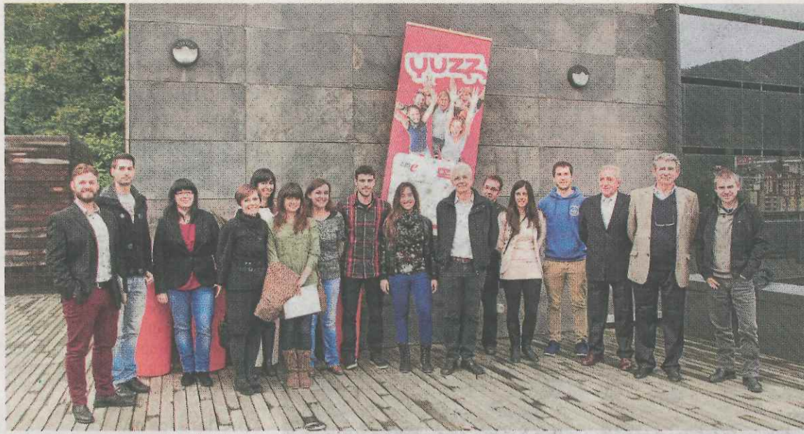
Los participantes en la edición del año pasado en la iniciativa Yuzz.