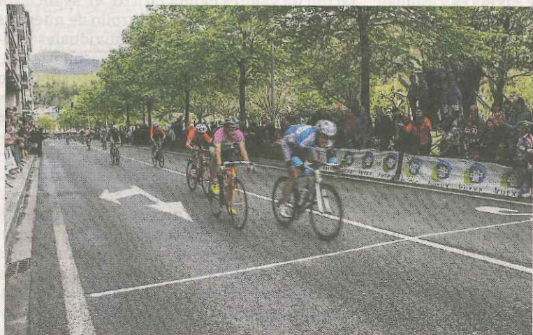
Txirrindulariak helmugara iristen aurreko lasterketa batean.

Lehenengo lasterketa martxoaren 7an egingo da. Egun honetan, 27. Deba Saria aurrera eramango da.