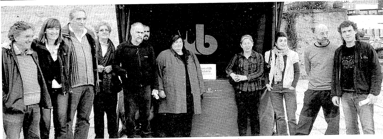
La iniciativa pretende dignificar y reglamentar la venta directa de los productos de caserío.

No será hasta el 4 de marzo, a las 22.15 horas, cuando tenga lugar el primer espectáculo teatral con Hermanos de Baile , uno de los grandes éxitos de taquilla de la temporada pasada.