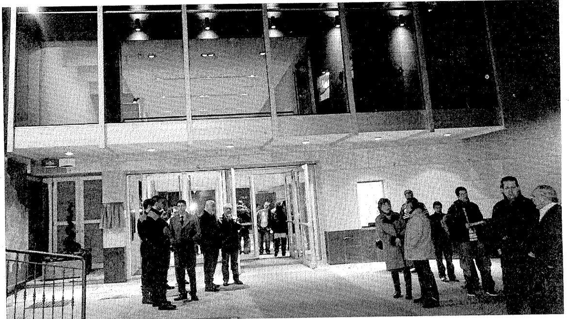
Las puertas del nuevo Ermua Antzokia se abrieron a la ciudadanía con una gala inaugural.

PRIMERAS ACTUACIONES Tras la inauguración oficial el Ermua Antzokia ya está preparado para acoger las numerosas actuaciones y activi-