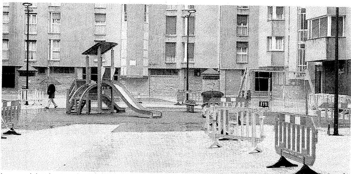
La remodelación del parque de Jacinto Olabe preveía un espacio de juegos para niños. MORQUECHO

ción de la plazoleta, se han llevado a cabo otra serie de actuaciones como una zona de juegos de niños sobre pavimento multicolor de caucho, la colocación de ocho bancos y de un pasamanos de acero inoxidable sobre el murete de cierre de la plaza y el saneado y pintado del cierre metálico actual. De momento, queda pendiente la nueva iluminación con cuatro columnas de seis metros de altura y dos luminarias tipo led por columna.