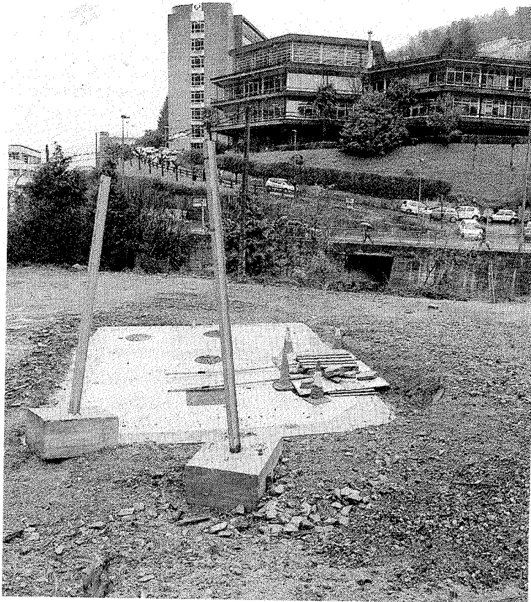
El colector de Ermua está finalizado para unirlo a Eibar. MORQUECHO

El proyecto total se componía de diferentes trazados esenciales: uno que une Mallabia con la instalación general de Ermua, en la zona del polígono de Urtía; otro que une Goitondo con Okinzuri, con la sustitución del colector de Ermua en el tramo entre Zubiaurre número 2 y la Avenida de Bizkaia número 6, pasando por Komutukua y la construcción de dos colectores a los lados del río a la altura de la Avenida de Gipuzkoa número 6. Asimismo se sumaba otro proyecto de creación de una nueva conducción en toda la Avenida de Gipuzkoa. A partir de aquí, se