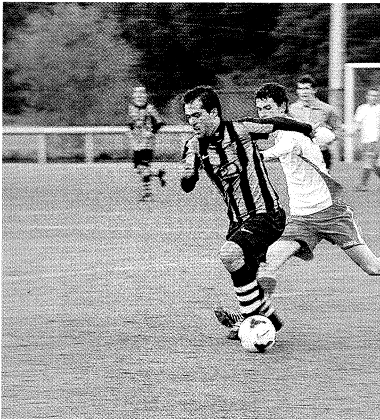
El Amaikak de Preferente se impuso en Errota Zar. :: ANDER SALEGI