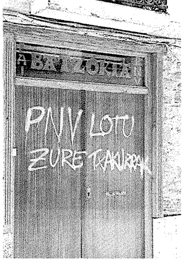
Pintada en la fachada.

El portavoz jeltzale en la Corporación municipal debarra, Unai Leku-