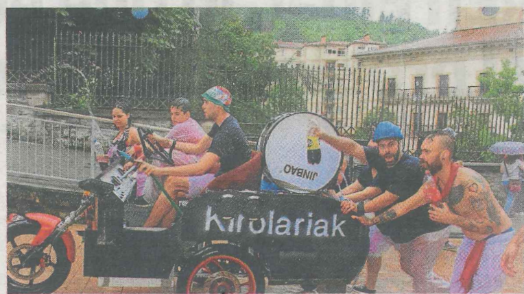
La txaranga 'Kirolariak' con su carrito de kalimotxo.

* EL CORREO no se hace responsable de cambios de última hora