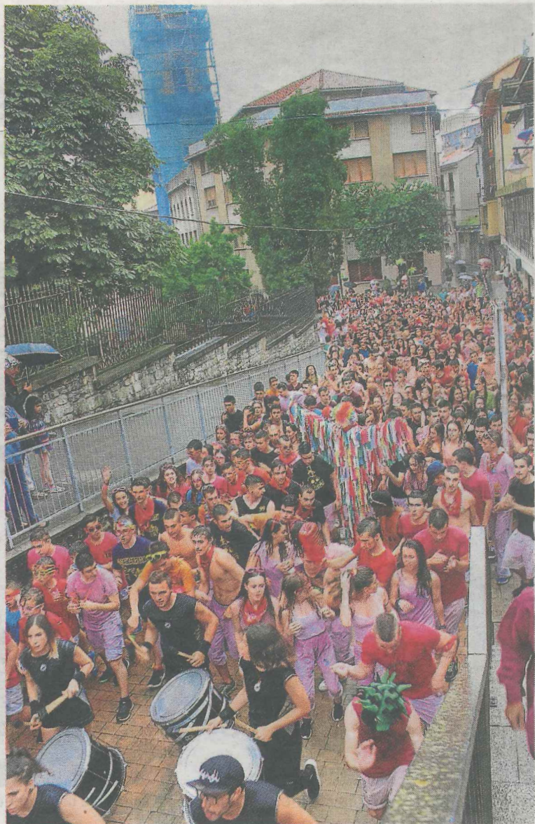
'La Polola', con los 'txarangeros' durante el desfile.

Desde las 23.00 hasta altas horas de la madrugada se bailará con la verbena Vulkan Show en la plaza, mientras que durante ese mismo tiempo, en la plaza 8 de marzo, se podrá disfrutar del festival techno con los DJs Amsia (Analog Live), Alexander Martínez, Aitor Araujo y Blanco.