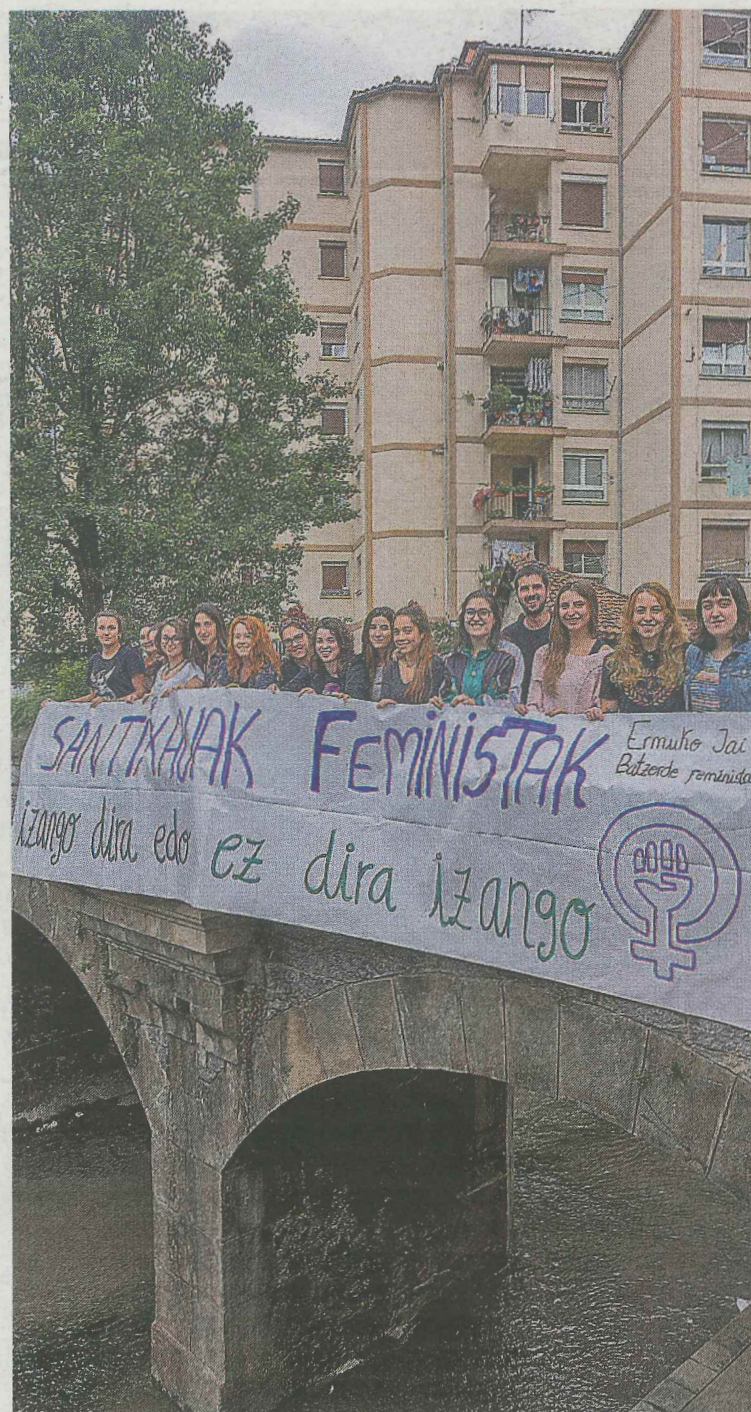
Iaz sortu zuten Ermuko Jai Batzorde Feminista.

Diotenez, emakumei dagokie aurrean egotea, besteak beste, bere espazioa aldarrikatzeko. Baina jai feministak lortzeko gizarte osoaren lana ezinbestekoa dela diote. Horregatik gonbidatu dituzte herritar guztiak bihar Eskilarapeko Ateneoan antolatu duten eta «denentzat gozagarri» izango den jaira.