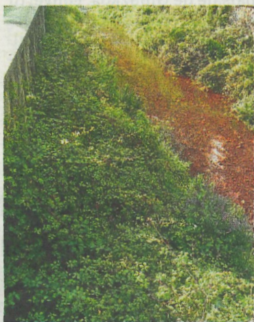
Maleza en el Kilimon. ZABALA

En muchos municipios guipuzcoanos la Agencia Vasca del Agua (URA) y el Ayuntamiento tienen suscritos protocolos de colaboración para actuar en los cauces y márgenes del río con el fin de proteger la salud medioambiental de ríos y cauces y ambas par-