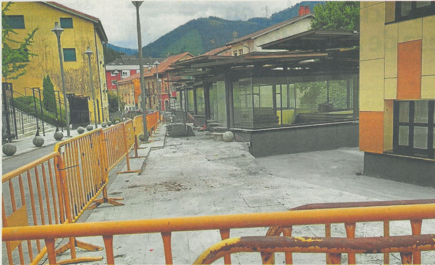
Las obras se iniciaron a comienzos de año para evitar las filtraciones de agua a los techos del Hogar del Jubilado. A.L.