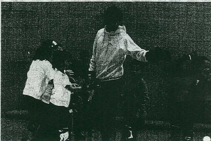
PATINAJE. Una de las actividades del programa 'Multikirolak'.

La Asociación de Comerciantes de la plaza del Mercado de Ermua celebrará hoy una txistorrada, cuya recaudación se entregará a la Asociación contra el Cáncer. A partir de las once de la mañana se entregará a quien lo solicite un pincho de chistorra, otro de morcilla y un vaso de vino o sidra, al precio de 2 euros.