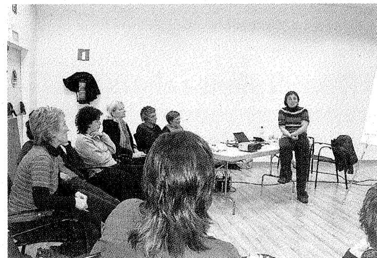
Autodefensa. Grupo de mujeres que participó en el cursillo.

Otra de las actividades organizadas contra la violencia hacia las muje-