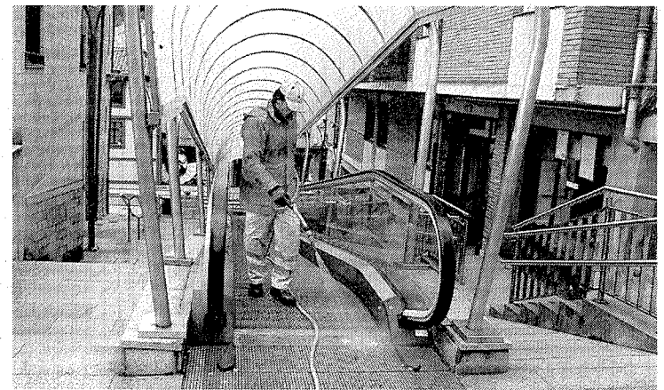
Labores de limpieza en la rampa mecánica del ambulatorio.

Esta actuación en la instalación eléctrica de Teresa Murga se inició en enero de este mismo año y pese a que se preveía su finalización en el mes de abril, ya se ha concluido. La adecuación de la electricidad del edificio a la normativa ha costado cerca de 71.000 euros.