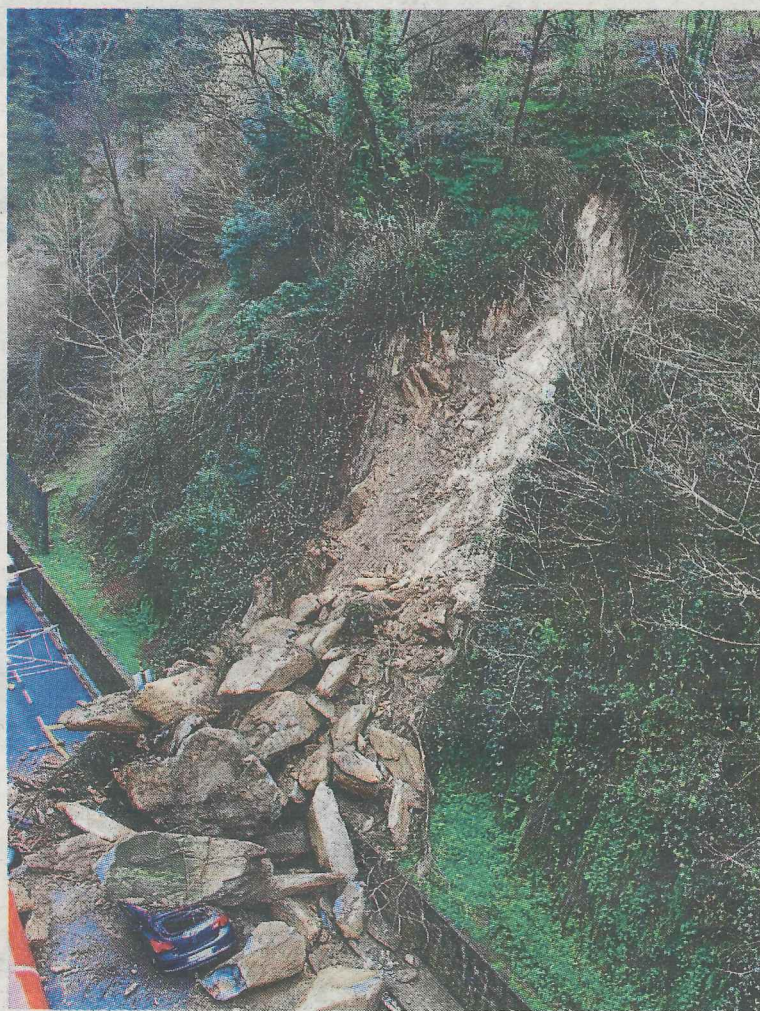
Talud de Goienkale donde se originó el derrumbe. ■ A. LASUEN

El estado de los taludes de toda la calle, que no son propiedad municipal,