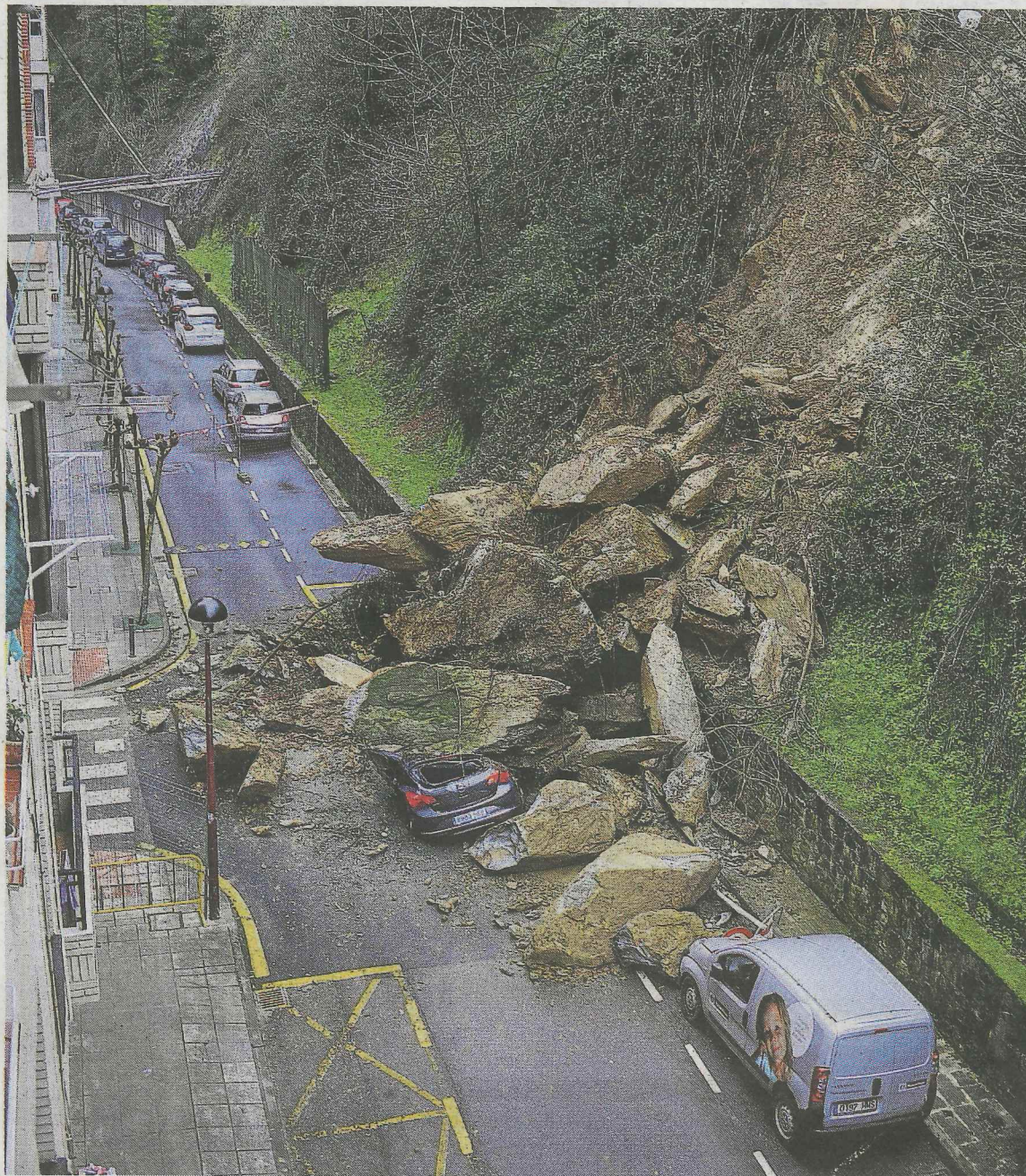
El desprendimiento de Ermua dejó coches destrozados y a los vecinos con el susto en el cuerpo.

También lamentaron que la Administración les contacte para remediar en vez de prevenir. «Las cosas se hacen sin planificación. Primero se realiza el desmonte, y después se piensa en cómo se arregla ese talud