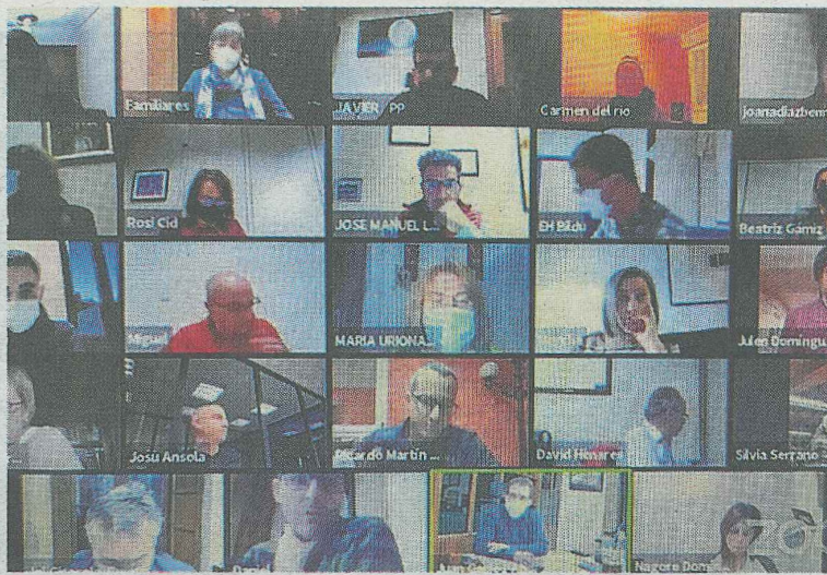
La corporación municipal se reúne ahora en Comisiones virtuales.

Entre las cifras incluidas en el informe de liquidación también cabe destacar los ingresos que,