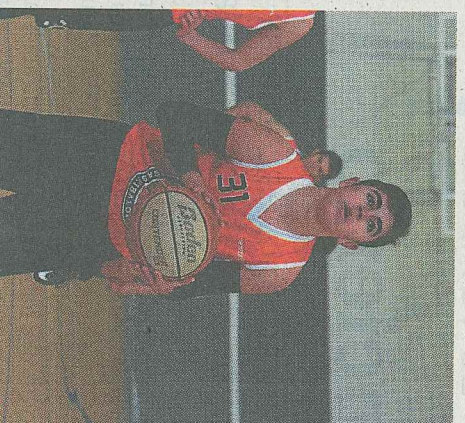
El Gora Behera consiguió imponerse al Arrasate y Ramírez fue el máximo anotador del equipo debarra. A. SALEGI