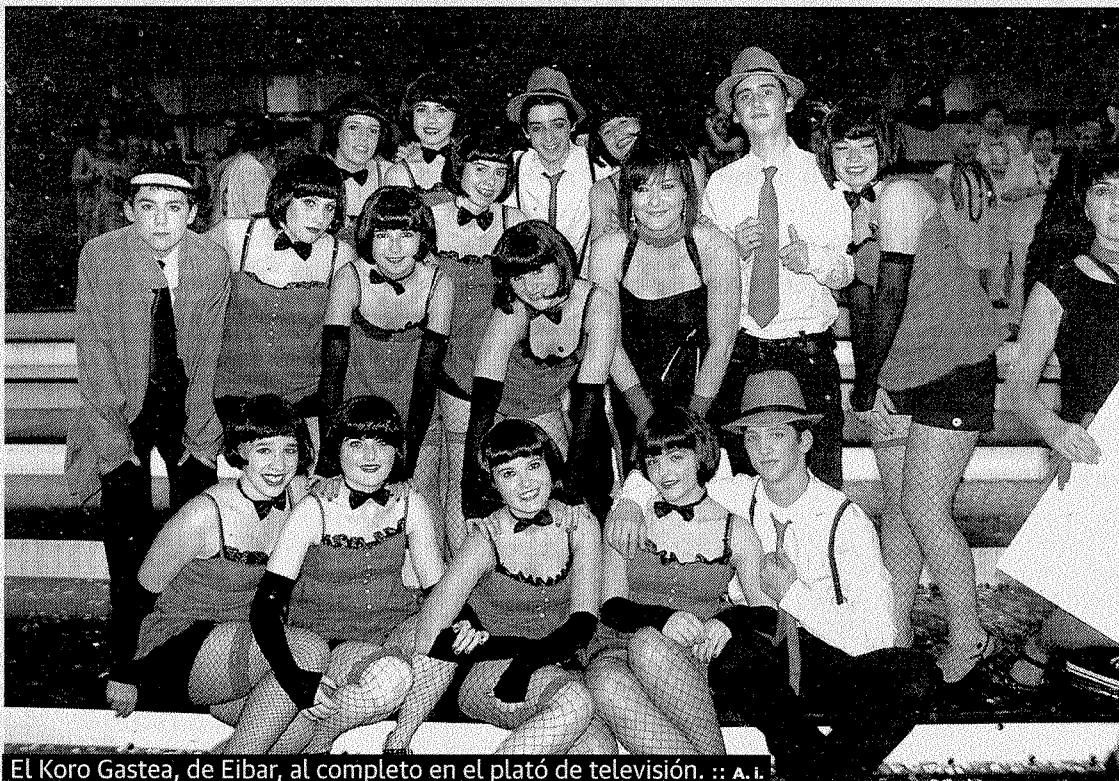
El Koro Gastea, de Eibar, al completo en el plató de televisión. :: A. I.