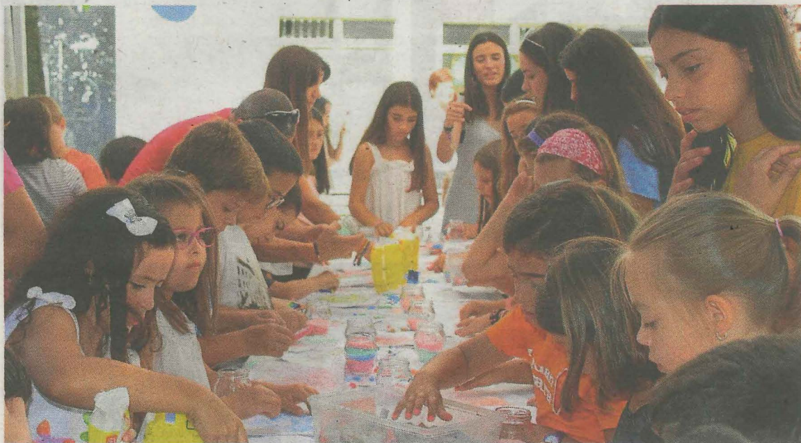
La población infantil participa en el Día del Niño y la Niña, en una edición anterior de los 'Santiagos'. A. LASUEN

Cada participante podrá presentar un dibujo, en tamaño A4, y se podrán utilizar pinturas, rotuladores, ceras y acuarelas. Las obras deberán incluir obligatoriamente la leyenda «Santiagos 2020 Ermuko Jaiak», y se entre-