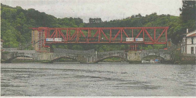
Estado actual del puente viejo de Deba.