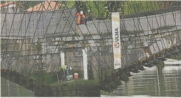
Operarios trabajando en las obras del puente.