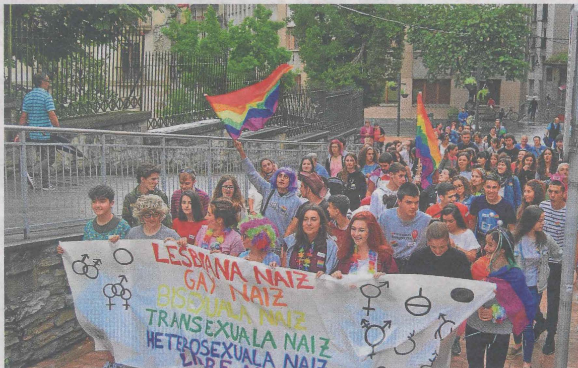
Una de las primeras manifestaciones que se convocaron en apoyo al movimiento LGTBI en Ermua.

Así, todas las áreas y servicios municipales que promuevan este tipo de recogida de datos estadísticos incluirán una tercera casilla más allá