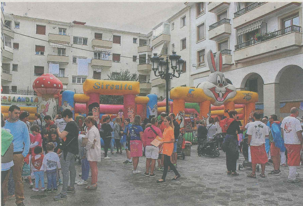
Los más pequeños pudieron disfrutar de los hinchables instalados en la Plaza San Martín.