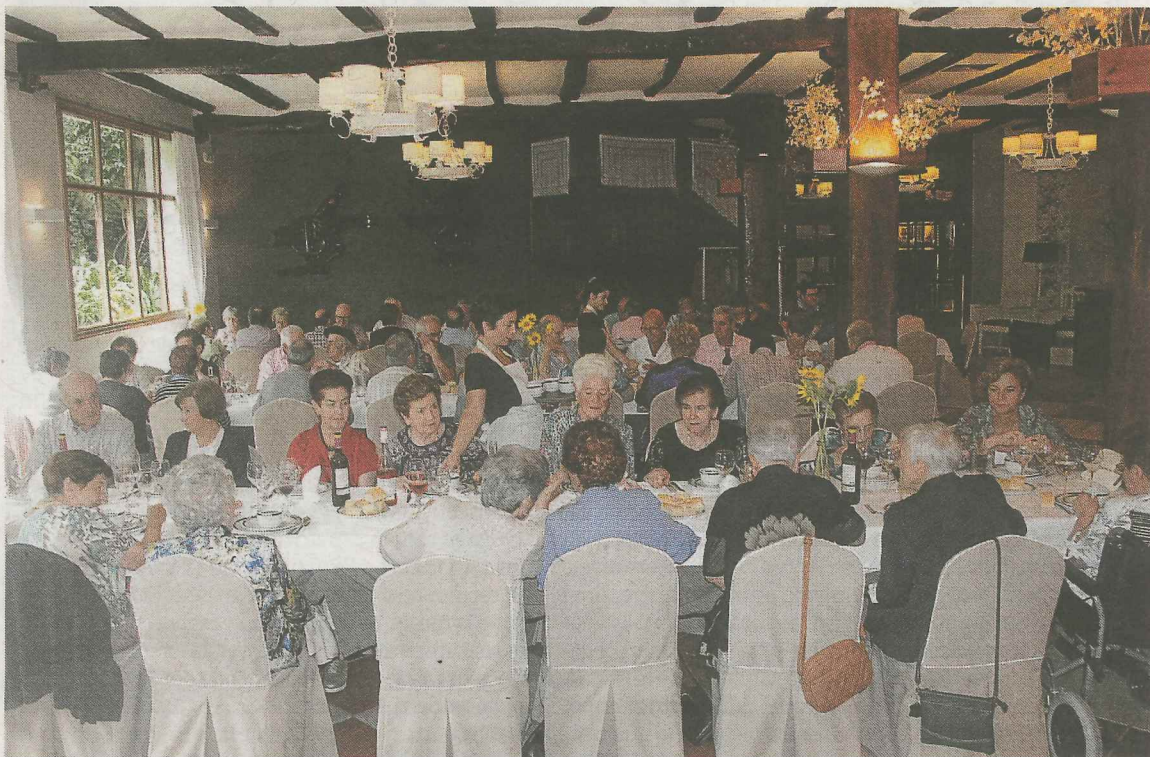
60 lagun inguru bildu ziren Salegi jatetxean urtero bezala.