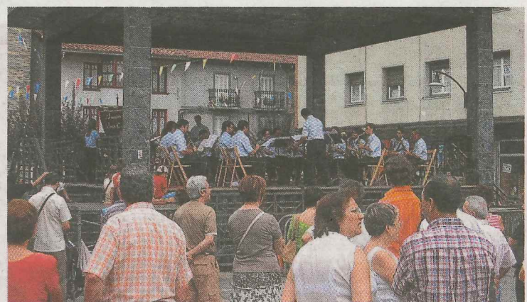
Concierto. La banda, tradicional en el día de los mayores.

A las 22.30 horas, la plaza San Pelayo acogerá un espectáculo de calle a cargo de Tio Teronen semeak y a las 23.00 horas en la plaza comenzará una verbena a cargo de la orquesta Diamante Show.