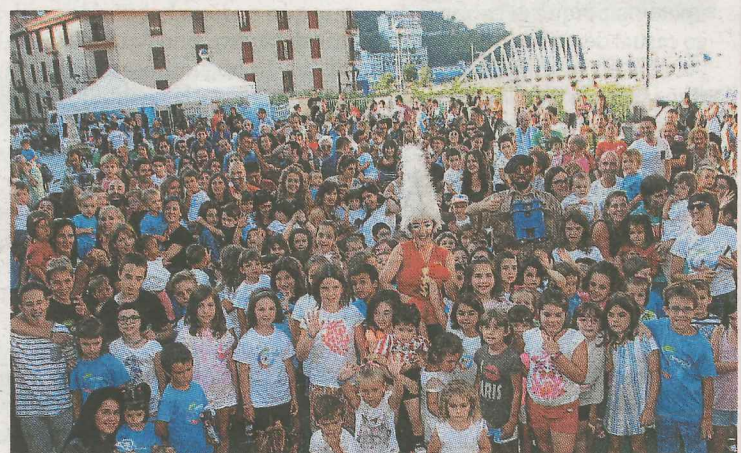
Solidaridad. La fiesta fue seguida por muchos chavales. :: ARNASA

Hubo puntos informativos con venta de material, cuyos fondos serán destinados a Arnasa. Por la tarde, hubo encierro con toro mecánico para los txikis, además de payasos, txosna, etc. De despedirse hizo una foto oficial con los participantes. Todo amenizado con alegre música.