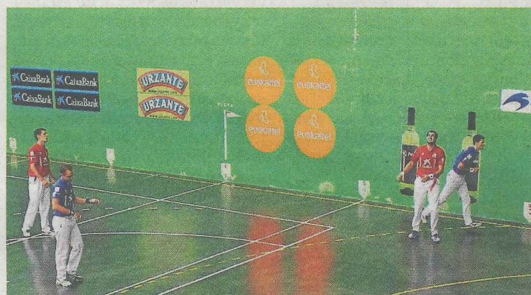
Los partidos de pelota en el frontón fueron emocionantes.

* EL CORREO no se hace responsable de cambios de última hora