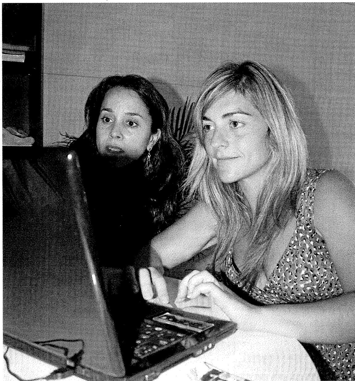
Margube tiene ahora su sede en el edificio Izarra Centre de Ermua. •• AINHOA LASUEN

—¿Cuántas personas trabajan en su empresa?