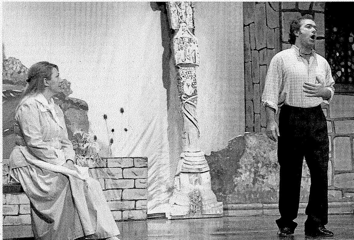
Representación de 'Los gavilanes' a cargo de la Masa Coral del Ensanche, que hoy está en Ermua.

Sobre el escenario, 16 actores y cantantes de la Masa Coral del Ensanche harán las delicias de los amantes de la zarzuela que se acerquen al Antzokia. No en vano, la Masa Coral del Ensanche es una entidad musical especializada en las representaciones de zarzuelas, antologías y conciertos líricos desde hace más de un centenar de años. Su andadura musical empezó allá por el año 1903, en un caserío del Ensanche de Bilbao y por sus locales han pasado gran número de